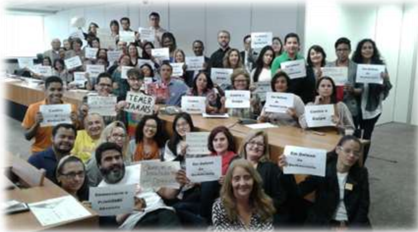
Coletivo que construiu a Carta Aberta a Sociedade.