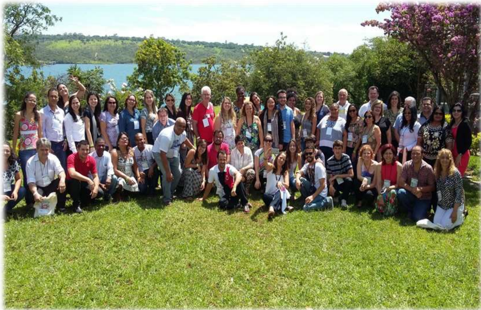
Participantes da Assembleia Geral do FNDCA